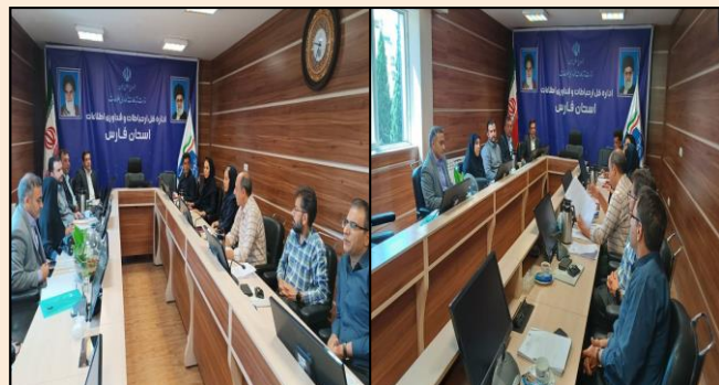
جلسه کارگروه دفاتر پیشخوان خدمات دولت و بخش عمومی استان در خصوص مسائل دفاتر پیشخوان خدمات فارس با اداره کل تامین اجتماعی فارس