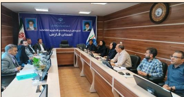
جلسه کارگروه فنی تسهیلات بند الف تبصره ۱۸ ماده واحده قانون بودجه سال ۱۴۰۱