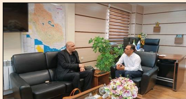
دیدار با مدیرعامل شرکت کارخانجات مخابراتی ایران