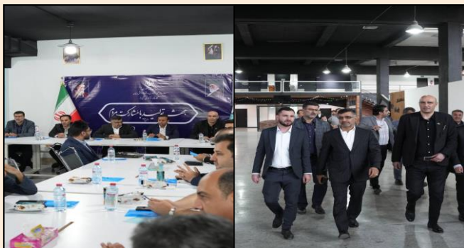
بازدید مدیرعامل شرکت ایرانسل از شرکت ها و تیم های فنی مستقر در کارخانه نوآوری شیراز جهت سرمایه گذاری و توسعه محصول