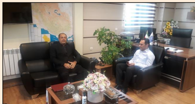
دیدار با مدیرعامل منطقه جنوب شرکت رایتل در خصوص تعاملات فیمابین