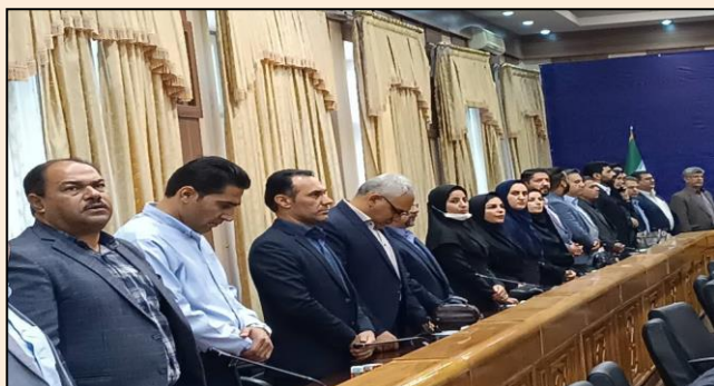
شرکت در جلسه شورای اطلاع رسانی استان با حضور معاون سیاسی، امنیتی و اجتماعی استانداری فارس